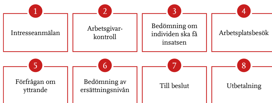
Figur 1 Förenklad beskrivning av hur det vanligtvis går till när Arbetsförmedlingen fattar beslut om en subventionerad anställning 46

Arbetsförmedlingen har under senare år gått mot en alltmer specialiserad och likriktad handläggning av subventionerade anställningar.