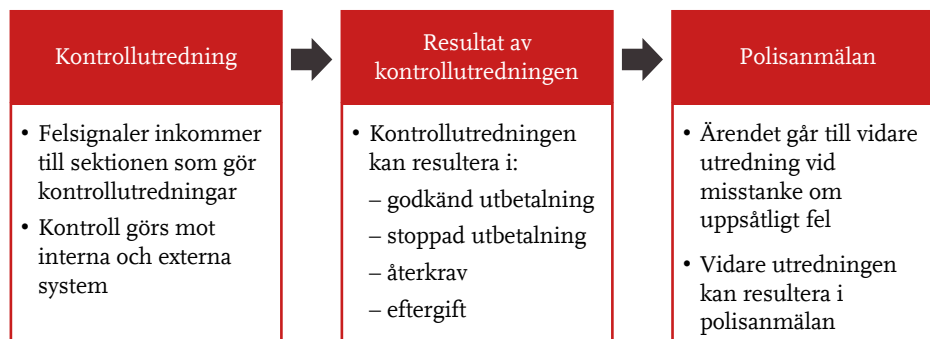
Figur 4 Arbetsförmedlingens process för att hantera misstänkta fel