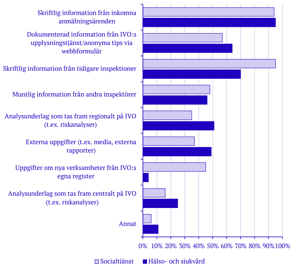
Diagram 3. Vilken eller vilka är de viktigaste källorna för information när du planerar tillsyn? Andel i procent, efter tillsynsområde.

I resultaten ser man också att respektive tillsynsområde använder sig delvis av olika källor. Inom område socialtjänst använder till exempel nära hälften av inspektörerna, 45 procent, uppgifter om nya verksamheter från IVO:s egna register, en källa som knappast används alls i område hälso- och sjukvård.