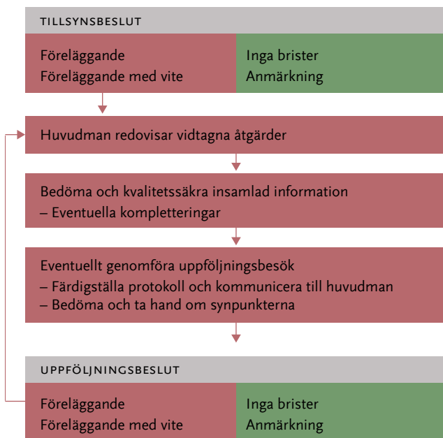
Figur 2 Process för uppföljning av tillsynsbeslut om föreläggande med eller utan vite