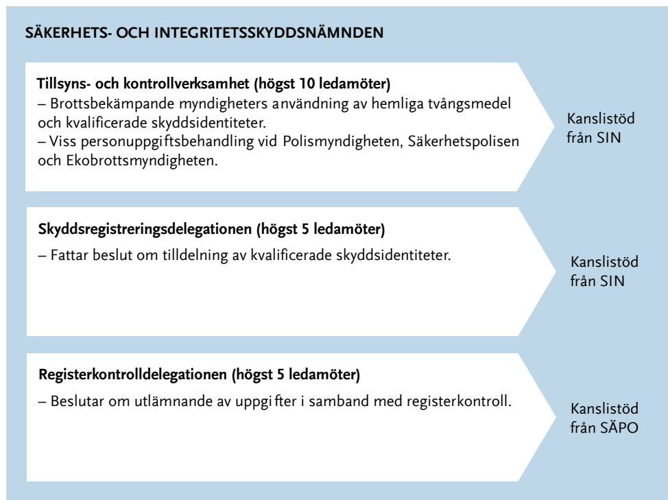
Figur 1 Schematisk organisationsbeskrivning

Nämndens sammansättning och uppgifter framgår av lag medan delegationernas sammansättning och uppgifter samt kansliuppgifterna framgår av en förordning. 6