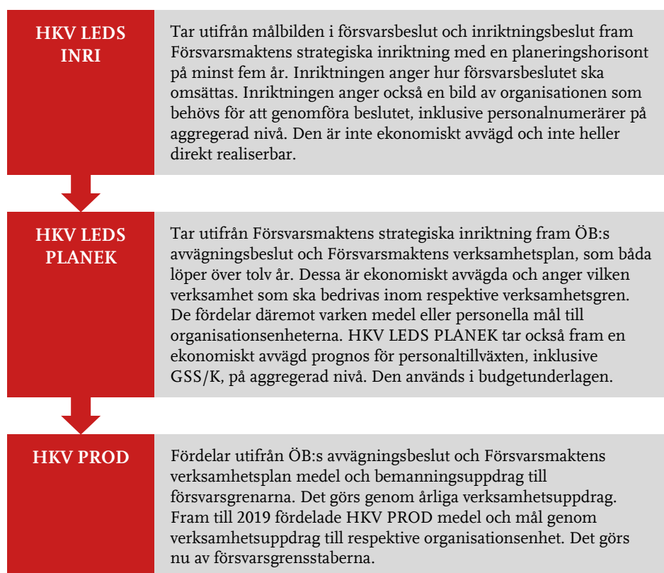
Figur 2 Försvarmaktens planeringsprocess och interna styrning