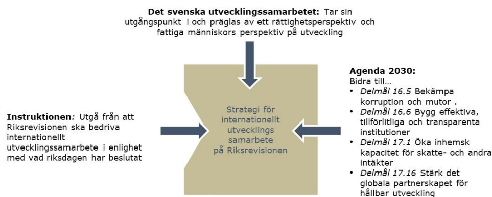
Figur 1. Strategin i ett nationellt och internationellt perspektiv

Vi bidrar till att i utvecklingsländer stärka nationella revisionsorgans kapacitet och förmåga att bedriva revision enligt internationellt överenskomna principer, standarder och riktlinjer. Strategin för Riksrevisionens internationella utvecklingssamarbete anger mål och inriktning och identifierar prioriteringar för verksamheten. Strategin gäller under perioden 2022–2025 och ses över årligen då tidsperioden flyttas fram ett år. Den omfattar de medel som årligen anvisas av riksdagen till anslaget 1:5 Riksrevisionen inom ramen för utgiftsområde 7 Internationellt bistånd. Medlen ska användas i överensstämmelse med OECD:s biståndskommittés (DAC) definition av bistånd och inom ramen för målen för svensk biståndspolitik.